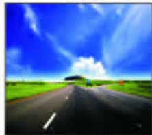
Internal tire Road