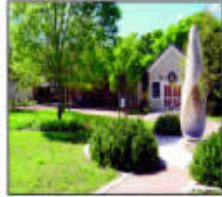
Plantation & Land scape Garden