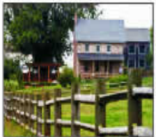
Individual Tar Fencing